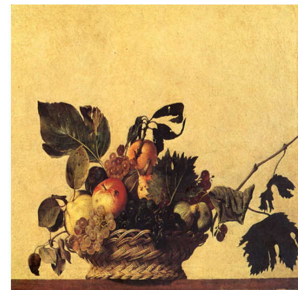
Milano Pinacoteca Ambrosiana Caravaggio - Canestra di frutta 1597

Campagna promossa dall'ASL Provincia di Milano 1, in collaborazione con gli Ospedali, le Farmacie ed i Medici di Famiglia del territorio.